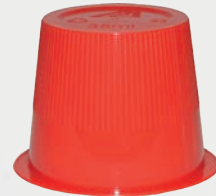
Art.-Nr.: MP-HcM172; rot - 35 ml