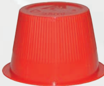
Art.-Nr.: MP-HcM169; rot - 25 ml