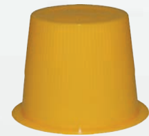
Art.-Nr.: MP-HcM173; gelb - 35 ml