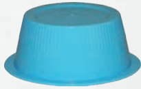
Art.-Nr.: MP-HcM165; blau - 15 ml