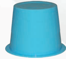
Art.-Nr.: MP-HcM171; blau - 35 ml