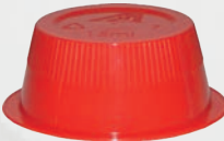
Art.-Nr.: MP-HcM166; rot - 15 ml