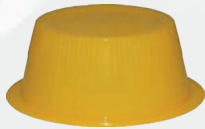
Art.-Nr.: MP-HcM167; gelb - 15 ml