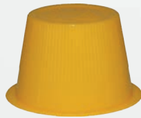
Art.-Nr.: MP-HcM170; gelb - 25 ml