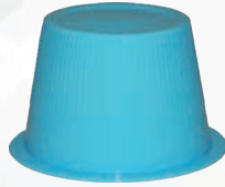
Art.-Nr.: MP-HcM168; blau - 25 ml